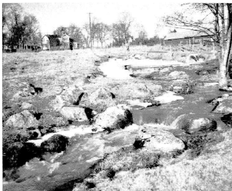
Infart till Måby gård

Bilderna är från föreningens fotoarkiv från ca 1940.