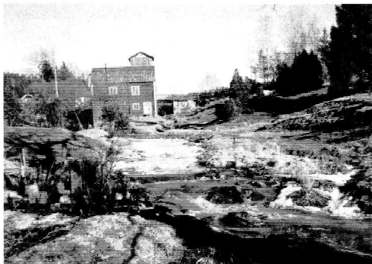
Kvarnen i Måby