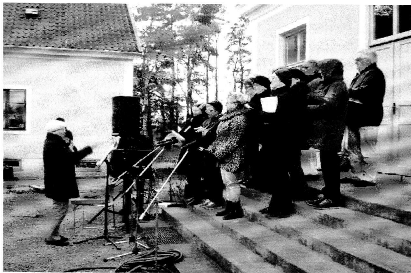
Sångfåglarna sjunger in våren.

Stämningen var gemyttlig trots vädret. Extra kul var att se så många barnfamiljer. Många av barn ville se skolsalen och hur en soldatfamilj bodde.