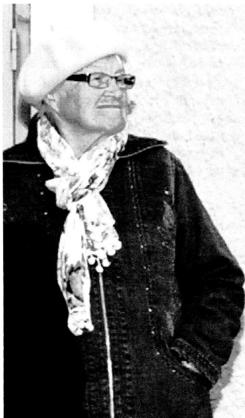
Har alltid sjungit

Eivors arbetskläder bestod av en grön klänning, grön kjol och blus och en hätta samt ett grönrutigt slaskförkläde. Kläderna fick man själv hålla med. Man bar tjänstenål med inskriptionen ”HV”.